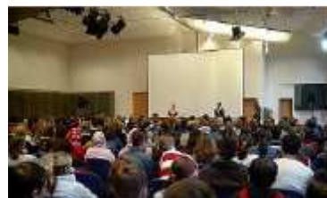
Multivisionsschau „Im Zeichen des Wassers“