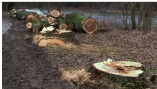
Baumfällaktion im Landschaftsschutzgebiet